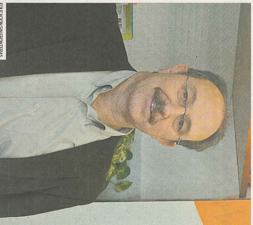
EDUCACION SIN FRONTERAS

E Bai. Kezkatuta gaude, gero eta administrazio publiko gutxiagok jotzen dutelako nazioarteko gaur-penerako lanbidetza beren arduratzen. Ulertzen dugu krisia dagoela eta kopuru orokorra murriztu beharke dela; baina ez dugu zer-tan ulertu laguntzen portzentajea murriztea; proportzioak berbera